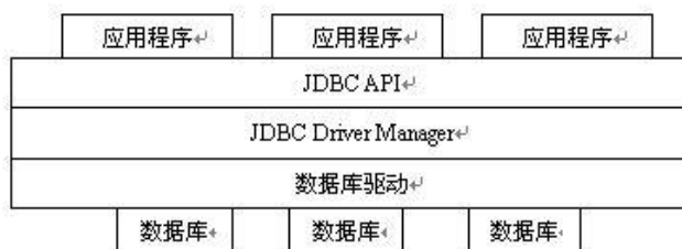
图 1-1 JDBC 结构